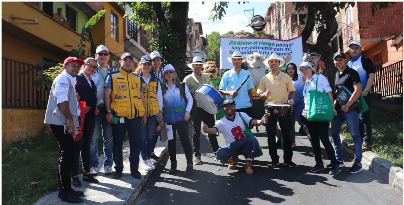
Actividades de FENALCO en barrios.

Por otra parte, respondiendo a la segunda prioridad del del marco de Sendai para la reducción del Riesgo de Desastres, “fortalecer la gobernanza del riesgo de desastres para la resiliencia”, se establecieron 29 alianzas con actores públicos y privados como un factor clave para impulsar las estrategias comunitarias en GRD y continuidad del negocio propuestas por el programa, promover entre las diferentes dependencias de la municipalidad las políticas y prácticas de la GRD y generar un relacionamiento entre los diferentes actores públicos y privados de la ciudad alrededor del riesgo de desastres. De modo que, a través de acuerdos de entendimiento se ejecutaron planes de trabajo que fortalecen los procesos formativos de los pequeños y grandes comerciantes, así como los miembros de las redes comunitarias.