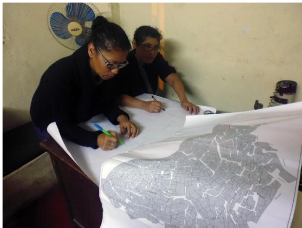
Implementación del Plan de Educación Comunitaria en Leticia (2016).

El proyecto RIMAC DRR 1 estuvo orientado a fortalecer la gestión del riesgo de desastre del distrito del Rímac bajo un enfoque de barrio, a través de la participación de la autoridad local y la comunidad. Luego de un análisis de la vulnerabilidad, cantidad de habitantes y capacidades de las organizaciones sociales, se identificó al barrio de Leticia, ubicado en el cerro San Cristóbal, como uno de los prioritarios del distrito para llevar a cabo la implementación. En dicho asentamiento las iniciativas de planificación fueron