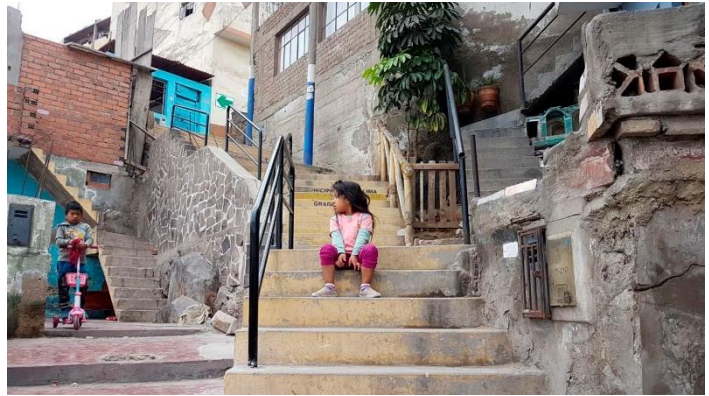
Niñas y niños protegidos con las nuevas barandas de Leticia (2017)

Gracias al trabajo de reconocimiento de las rutas de evacuación, producto de los mapas comunitarios, en el tercer año del proyecto se logró una intervención a nivel físico de mayor alcance. Se mejoró la accesibilidad peatonal del barrio, logrando resanar -o reconstruir en algunos casos- las escaleras de tres vías principales (Av. Túpac Amaru, Pje. Manuel Odría y Pje. Huanta) que al mismo tiempo permitirían la evacuación en caso de una emergencia.