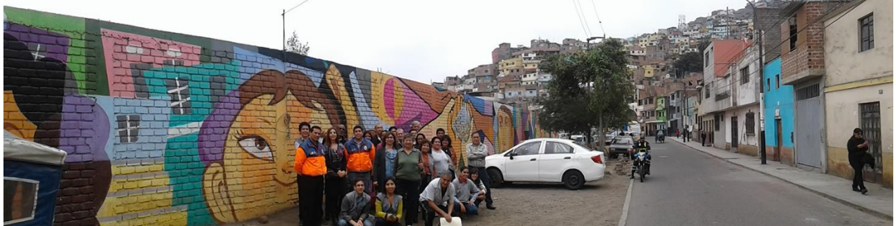
Muralización en espacios públicos de Leticia (2016)